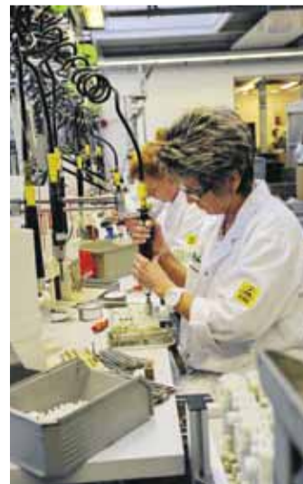
Innovative Produkte werden bei der Lüneburger Firma Clage am Pirolweg hergestellt.